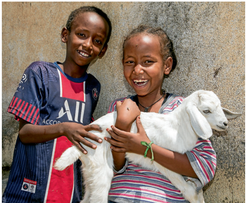
Grosse Freude: im Haus nebenan gab es Nachwuchs - ein Lamm